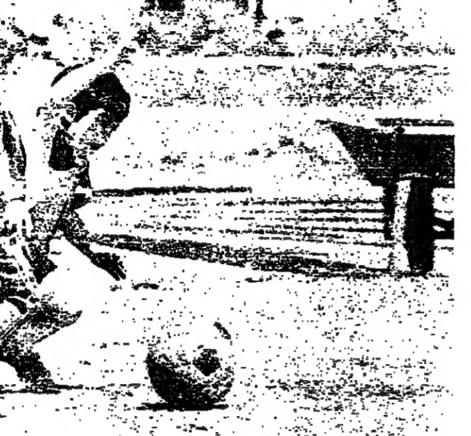
الاطفال .. على طريق بيليه